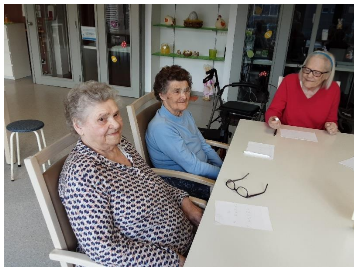
Een gezellige quiznamiddag!