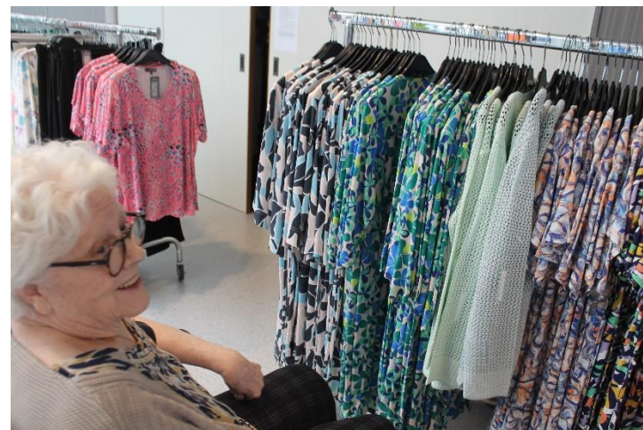
Kleurrijke kleren te verkrijgen tijdens de modeshow.