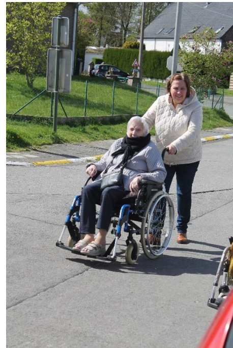
Samen gingen we op stap in Gavere en genoten we van de zon!